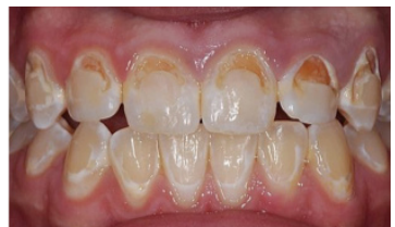
This shows what happens if you do not brush properly and eat sugary foods. It can lead to permanent damage.

It is important to see your orthodontist if any of the brackets are broken and this can be done as an emergency visit.